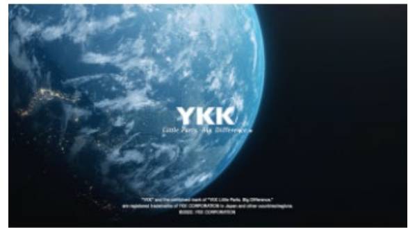
• YKK 理念之道

https://ykkdigitalshowroom.com/ch/gf/library/movie/426?category=branded