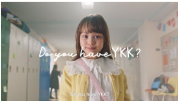
• 你有 YKK 吗?

该短片通过四大切入点为大家介绍“YKK”的企业姿态，以及作为身边生活、个性、风格的表现而存在的发斯宁产品，作为面向年轻一代的信息，进行着重推广。